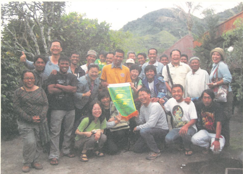
因主婦聯盟合作社的來訪，村落農友首次見到喝他們咖啡的台灣消費者。