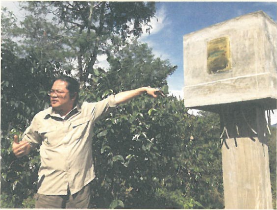
下：雨林咖啡契作的農戶採取友善環境的樹蔭栽培，果樹、咖啡樹和豆科喬木共生，減緩熱帶雨林的消逝。