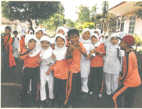
上：教育仍是脫貧的最佳途徑，雨林咖啡的社區回饋有相當比例用於提供獎學金、小學教科書以及樂器，圖為今年受贈樂器的村落小學。